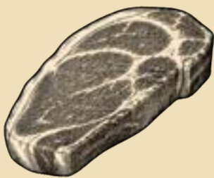
ENTRECÔTE (500G) 38€