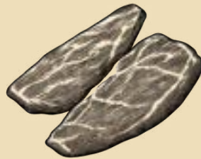
PLUMA DE PORC (500G) 32€